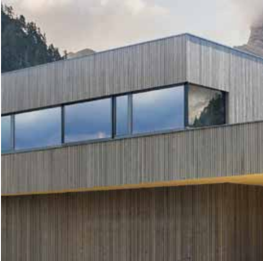
o Montage einer vorvergrautes Fassade im Jahr 2017