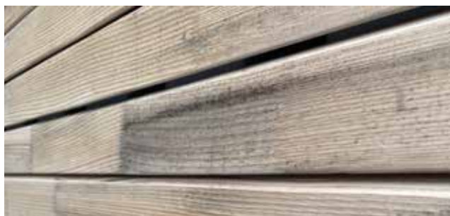
○ Weißtanne, keilgezinkt. Auftritt von harmlosen Bläuepilz, welcher die Qualität des Holzes nicht beeinflusst. Mit der Zeit wird das Holz durch den natürlichen Vergrauungsprozess in einen grauen/dunkelgrauen Farbton übergehen. Das Bild zeigt also einen Zwischenschritt