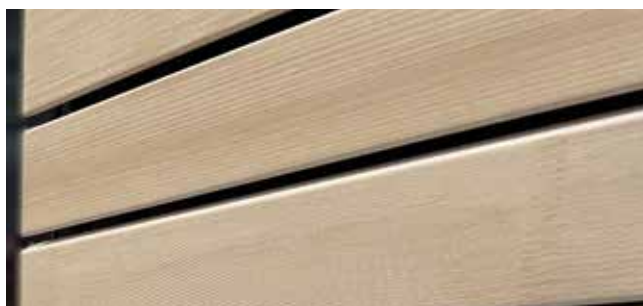
○ Weißtanne, keilgezinkt. Allgemeiner Neuzustand