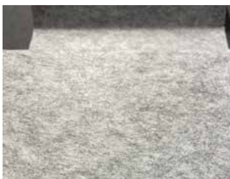
Vliesbeschichtung Normalzustand (Detail)

Detailaufnahme einer optionalen Vliesbeschichtung der Dachunterseite ohne und mit Schimmelbildung (Beispiel). Durch unzureichende Lüftung und die in der natürlichen Raumluft enthaltenen Sporen kann es zu einer Schimmelbildung am Vlies kommen. Dies ist kein Reklamationsgrund und der Schimmel kann in der Regel mit handelsüblichen Schimmelmitteln wieder entfernt werden.