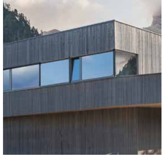
o Gleiche Fassade ohne Nachbehandlung im Jahr 2020