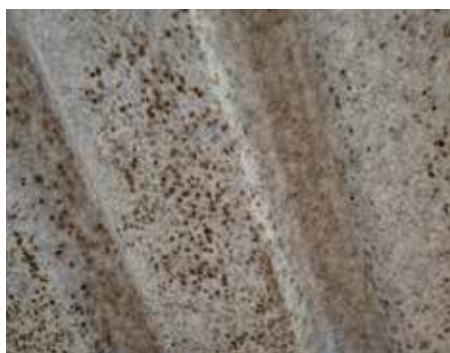
Vliesbeschichtung mit Schimmelbildung durch unzureichende Lüftung (Beispiel)

Detailaufnahme einer optionalen Vliesbeschichtung der Dachunterseite ohne und mit Schimmelbildung (Beispiel). Durch unzureichende Lüftung und die in der natürlichen Raumluft enthaltenen Sporen kann es zu einer Schimmelbildung am Vlies kommen. Dies ist kein Reklamationsgrund und der Schimmel kann in der Regel mit handelsüblichen Schimmelmitteln wieder entfernt werden.